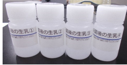
殺菌後の生乳採取用 4 本

殺菌前の生乳を 4 本（赤線ラベル）と殺菌後の生乳を 4 本（青線ラベル）の計 8 本採取してください。