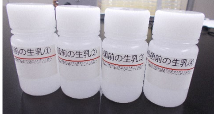
殺菌前の生乳採取用 4 本